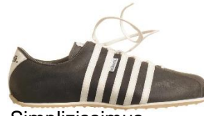
Simplizissimus 2004-2012, erneut seit 2022