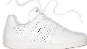
K-Line seit 1990