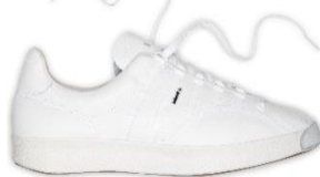
Winner seit 1989