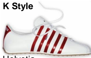
Helvetia seit 2004