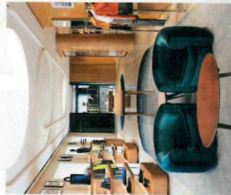
Blick ins erste Geschoss des neuen