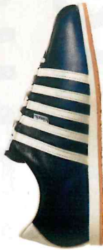
Turnschuh «Fides» (299 Fr.), feines Rindsleder, von Künzli.